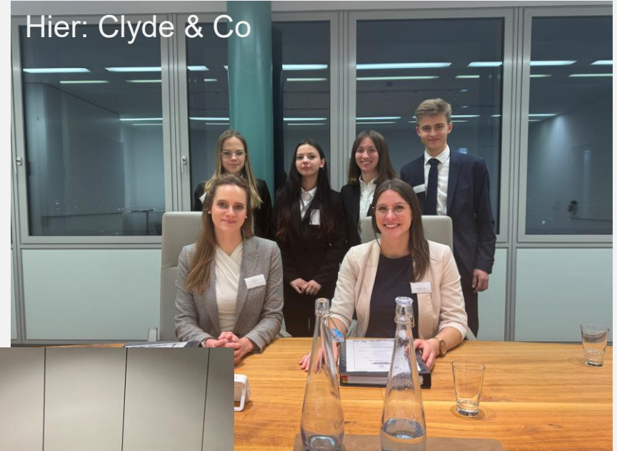
Hier: Clyde & Co