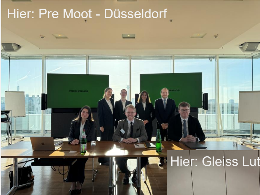
Hier: Pre Moot - Düsseldorf